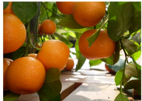
Krajina v Chorvatsku